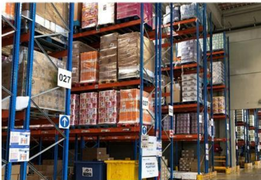
Figure 6 : Stockage en racks