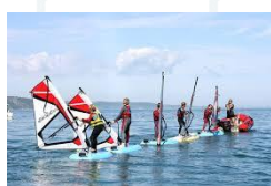
PLANCHE A VOILE